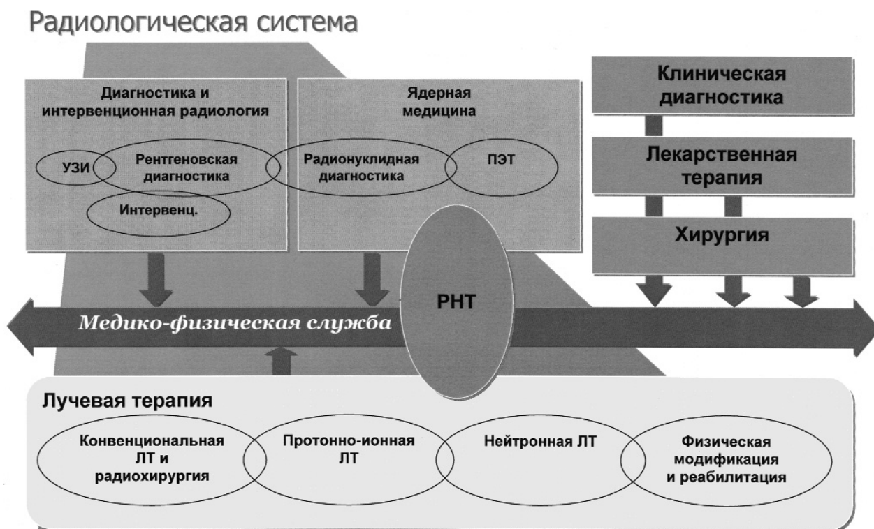
Рис. 1. Технологическая сетевая структура